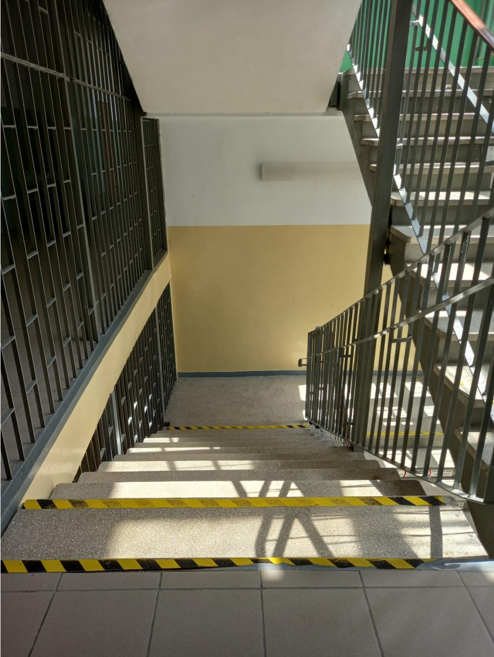
Widok z I piętra